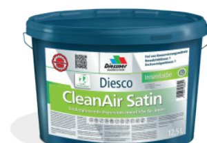
CleanAir Satin vægmaling