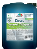
CleanAir Dybdegrunder W

Produkter uden konserveringsmidler i samme serie