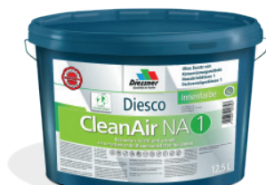
CleanAir NA 1