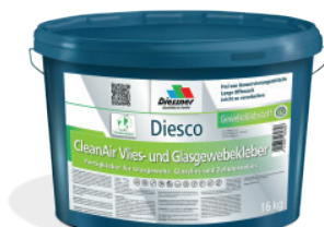
CleanAir Filt & vævklæber