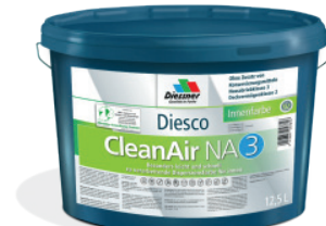
CleanAir NA 3