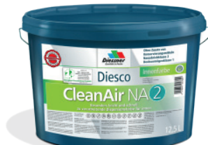
CleanAir NA 2