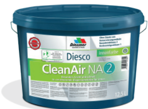
CleanAir NA 2