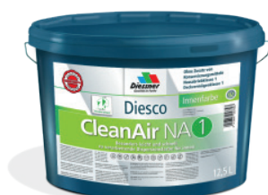
CleanAir NA 1