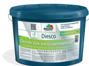
CleanAir Filt & vævklæber