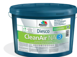
CleanAir NA 3