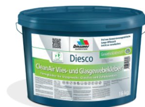
CleanAir Filt- og Vævklaeber