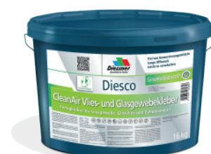
CleanAir Filt- og Vævkæber