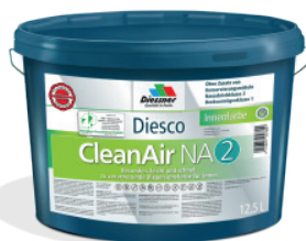
CleanAir NA 2