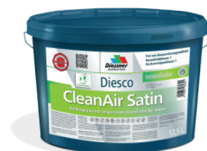
CleanAir Satin vægmalning