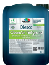
CleanAir Dybdegrunder W