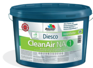
CleanAir NA 1