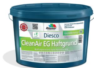
CleanAir EG Haftgrund