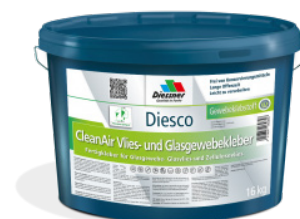
CleanAir Filt- og Vævklaeber