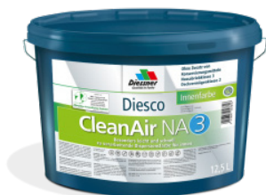
CleanAir NA 3