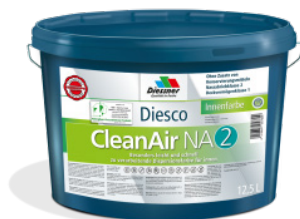
CleanAir NA 2